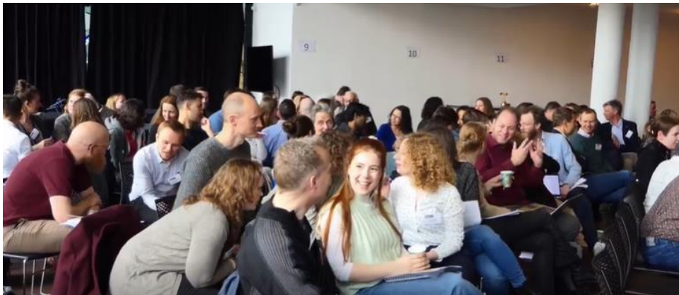
Uitwisseling tijdens het StuKO symposium, april 2023

Het project streeft naar deelname van zowel universiteiten als hogescholen in Nederland en is gestart met 5 instellingen: de UU, de RUG, de VU, de TUE en ISO. Het project begint rond te zingen, zeker sinds het symposium in april 2023. Inmiddels zijn het UMCA, de HvA, de MU, de UvA, de HAN, de RU, het NRO en de UNL ook betrokken en zullen de HU, InHolland, EUR, het UMCG en de Universiteit Leiden binnenkort aansluiten.